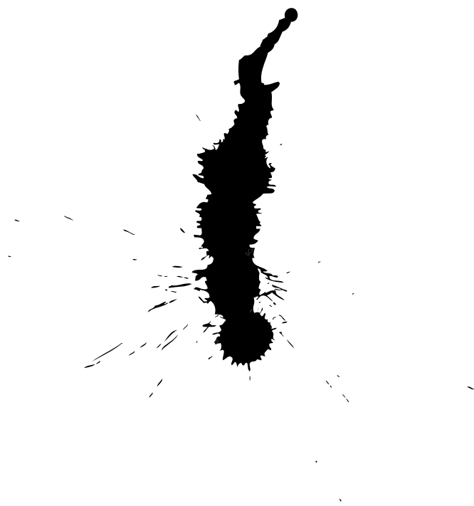
Kaňka ilustrace ze sešitu neznámého studenta, 1971